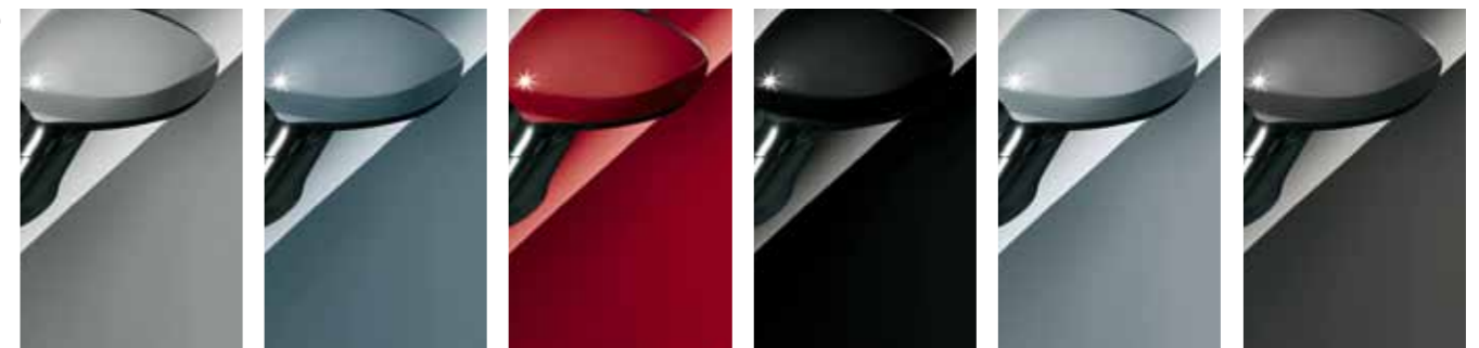
595 Šedá Chemical