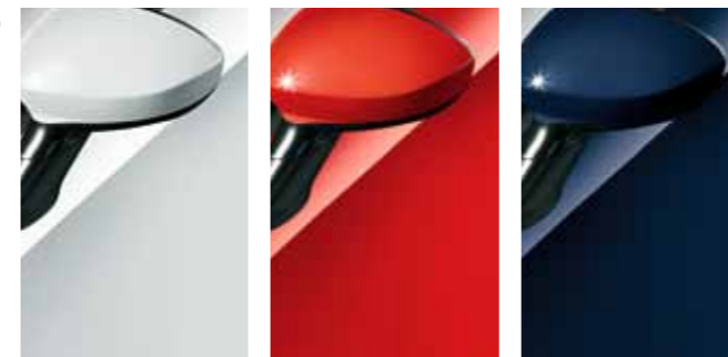
296 Bílá Divino